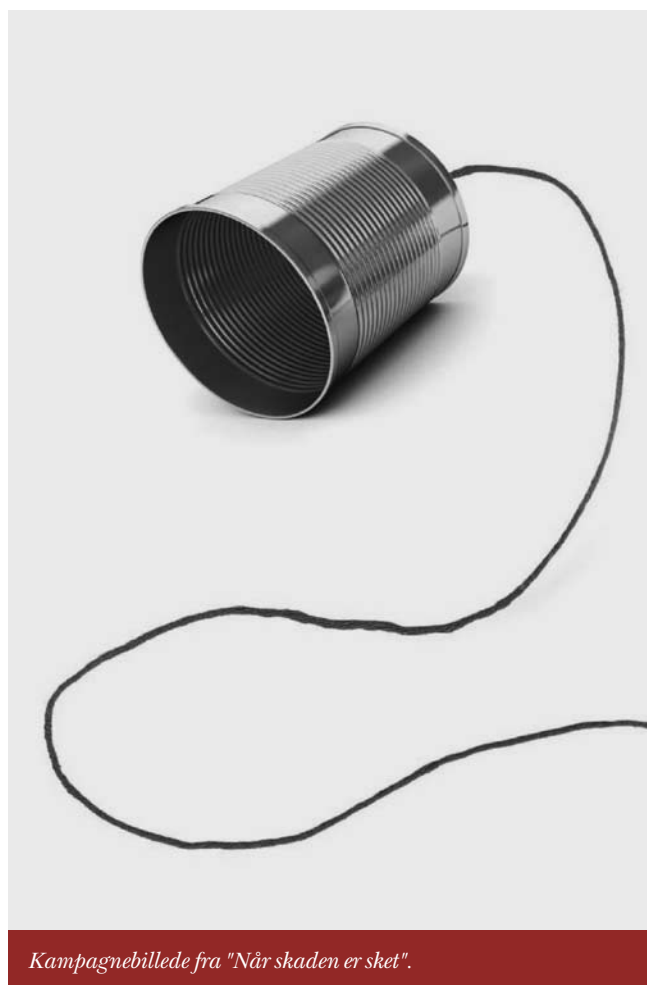
Kampagnebillede fra "Når skaden er sket".

Læringsættet vil indgå som en del af Partnerskabsprojektet, der er et af de to store projekter, som TrygFonden og Dansk Selskab for Patientsikkerhed arbejder sammen om de næste fire år.