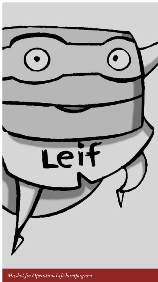
Maskot for Operation Life kampagnen.

Repræsentanter for kampagnesekretariatet har desuden holdt oplæg om Operation Life ved en lang række forskellige arrangementer i sundhedsvæsenet fx på mange sygehuse og ved arrangementer og møder i Sundhedsministeriet, Danske Regioner og TrykFonden.