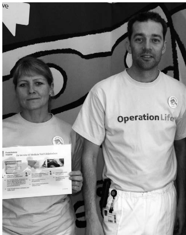
Personale iført Operation Life kampagne t-shirts