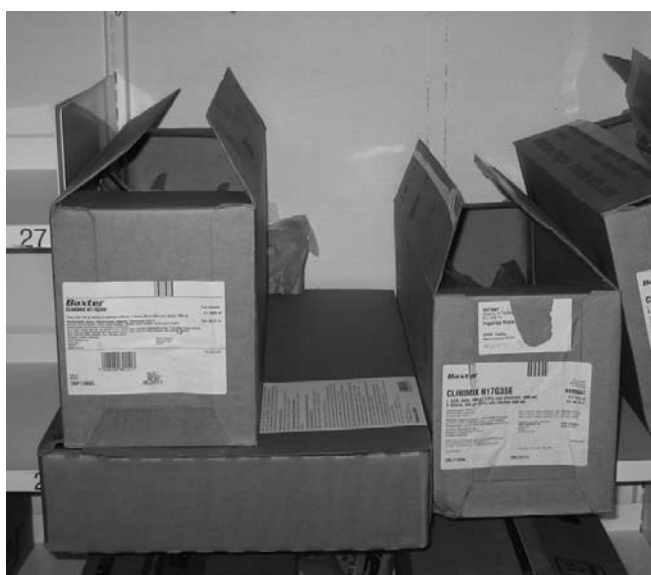
Rod i de fysiske rammer.

I 2009 har projektet samlet viden og analyseret data, således at der i 2010 kan udgives i alt fem pjecer. De to første omhandler selvmordsforebyggelse og faldforebyggelse og vil ligge klar til patientsikkerhedskonferencen den 26. april 2010.