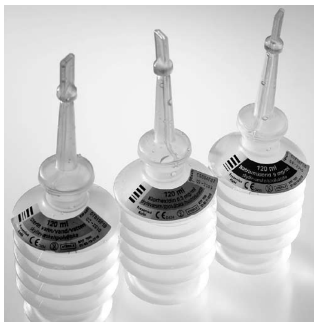
Eksempel på design af medicinemballage.